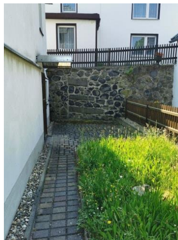
Sitzecke und Grünstreifen