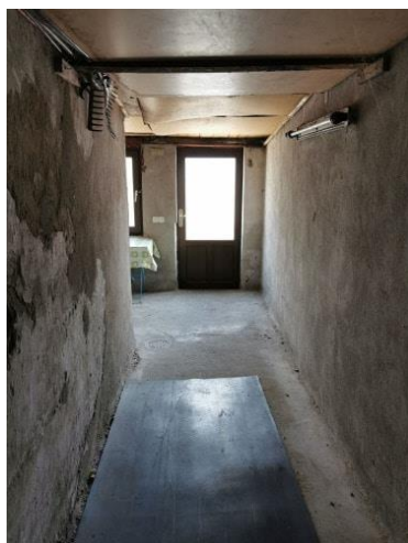
Anbau - Abstellmöglichkeit