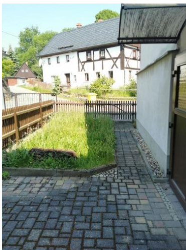
Sitzecke und Grünstreifen